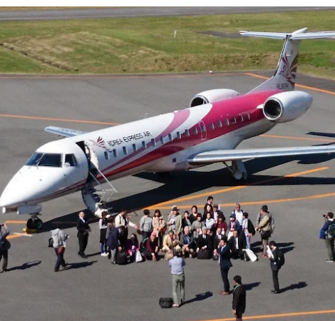
ボーダーツーリズムツアー五島・済州島で利用した 福江空港初の国際線チャーター便