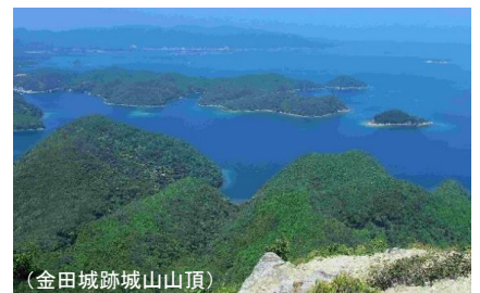
(金田城跡城山山頂)

共通のご案内：当プランは手配代行旅行となります。添乗員は同行いたしません。 [主催責任免責(当ツアーは手配代行旅行となります。旅行傷害保険をご希望の場合はお申し込み時にご用命ください)]