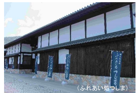
(ふれあい処つしま)