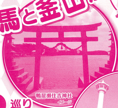
鴨居瀬住吉神社 イメージ