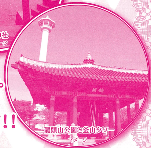
龍頭山公園と釜山タワー イメージ