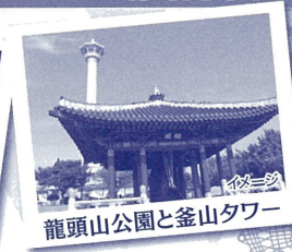
龍頭山公園と釜山タワー